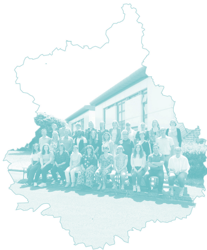
42 agents au service des collectivités et des établissements publics euréliens

Le CDG28 est dirigé par un Conseil d'administration qui détermine les orientations et le fonctionnement de l'établissement. Le Conseil d'administration décide notamment des nouveaux services à développer pour répondre aux besoins des collectivités et des établissements publics du département, des tarifs et des taux de cotisations.