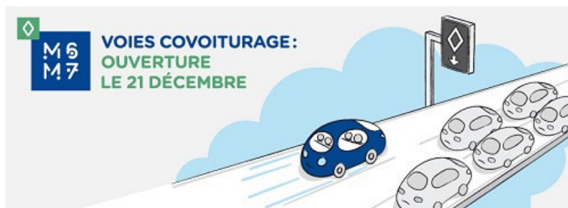
Annnonce de l'ouverture de la voie réservée au covoiturage à Lyon - Grand Lyon

Le domaine d'emploi correspond à l'affectation d'une voie de circulation à certaines catégories de véhicules ou à certains usages, sur un axe subissant une congestion récurrente .