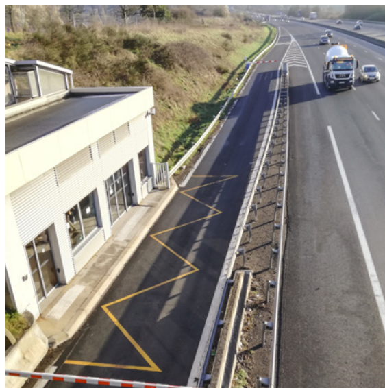
Bretelle d'accès réservée aux autocars express

d'accueil du parking. L'exploitation mise en place (comprenant 21 caméras de vidéosurveillance) sécurise le système, mais elle reste complexe et coûteuse.