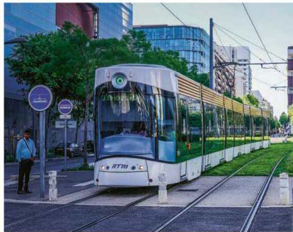
Au sein du bouquet d'aides à la mobilité figure une offre de six mois d'abonnement aux transports en commun.

Un « bouquet d'aides à la mobilité ». C'est ce que propose la métropole Aix-Marseille Provence pour accompagner la première ZFE du territoire, mise en place à Marseille en septembre 2022. Depuis, 19,5 kilomètres carrés de la ville sont interdits aux véhicules classés « Crit'Air 5 » ou hors catégorie, alors que le conseil métropolitain a voté, le 19 janvier, un plan de mesures. Il donne progressivement des gages aux propriétaires qui se débarrassent de leurs voitures interdites de circulation : après les « Crit'Air 5 », ce sera le tour des « Crit'Air 4 », le 1 er juin 2023, puis des « Crit'Air 3 », le 1 er juin