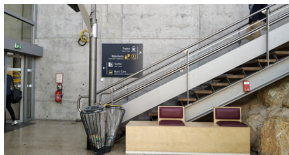
Zone d'attente à la gare TGV d'Aix-en-Provence

Dans chaque sens, une zone d'attente est aménagée à l'intérieur du bâtiment pour davantage de sécurité et de confort. Les usagers sont autorisés à attendre à l'intérieur ou à l'extérieur sur les quais. Les arrêts sont surveillés par des caméras. Les portes du bâtiment sont verrouillées la nuit lors de la fermeture de la gare.