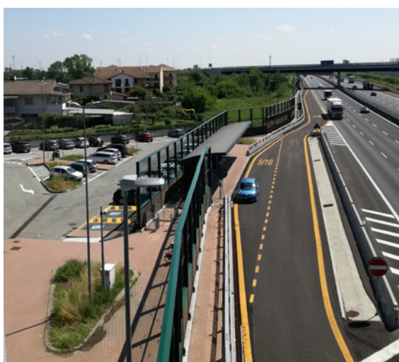
Arrêt de bus sur l'A4 à Galliate