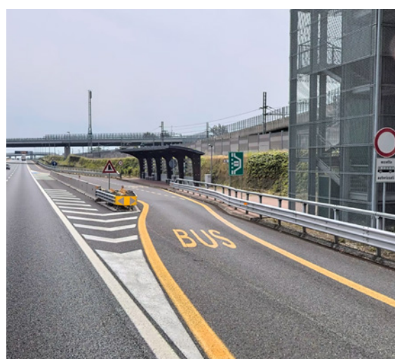
Arrêt de bus sur l'A4 à Galliate

Historiquement, les arrêts de bus italiens ont été construits pour pallier le manque de desserte ferroviaire entre les différentes villes sur le trajet de Turin à Milan.