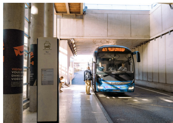
Arrêt de bus à la gare TGV d'Aix-en-Provence

Ces arrêts sont situés sous la gare TGV d'Aix-en-Provence et séparés de l'autoroute par un mur bétonné. De nombreux autocars circulent sur l'autoroute et empruntent les bretelles