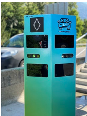
Solution de comptage du nombre d'occupants dans les véhicules de la société Pryntec – AREA

Comme mentionné précédemment, l'acceptabilité et l'efficacité des voies réservées passe également par un contrôle performant du nombre d'occupants permettant de vérifier que les véhicules présents sur la voie sont bien autorisés à y circuler.