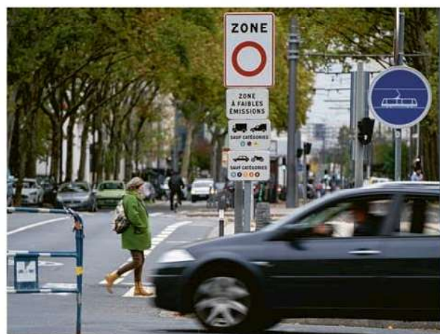
Un panneau indique l'entrée dans la ZFE. Les véhicules y sont autorisés ou en sont exclus selon leur vignette Crit'Air.

Même si les mesures financières sont plus incitatives à Lyon que dans d'autres agglomérations, elles restent peu sollicitées. Jusqu'ici, la métropole dénombre environ 200 entreprises aidées pour un montant estimé à 1,2 million d'euros. La mobilisation n'est pas plus importante s'agissant des particuliers, y compris chez ceux qui conduisent des « Crit'Air 5 », bannis de la ZFE depuis janvier. « L'absence de contrôle et de politique de commu-