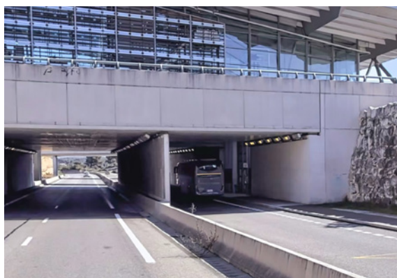
Accès des bus sous la gare TGV d'Aix-en-Provence

Ces arrêts sont situés sous la gare TGV d'Aix-en-Provence et séparés de l'autoroute par un mur bétonné. De nombreux autocars circulent sur l'autoroute et empruntent les bretelles