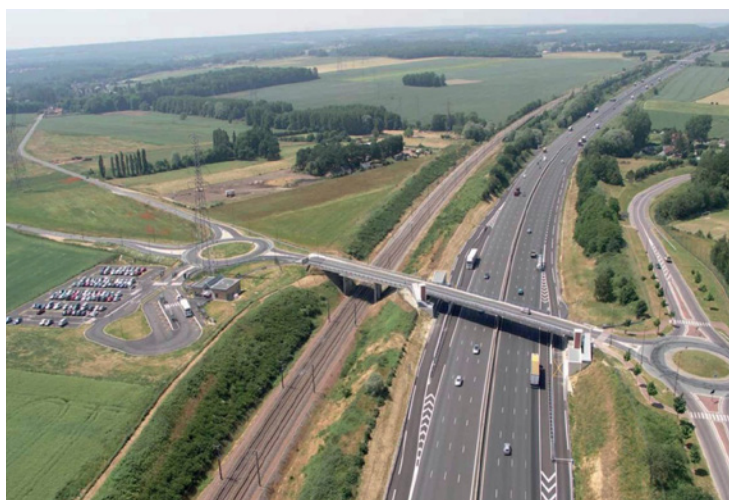
Vue aérienne du pôle d'échange

Les gains de temps de l'ordre de 30 minutes sont conséquents, et la gare autoroutière implantée sur un territoire enclavé offre aujourd'hui une solution performante de mobilité alternative. L'aménagement permet aux cars express de ne pas sortir de